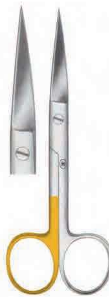
02 0414 13 1 Standard 130 mm Chirurgische Schere, gerade Operating scissors, straight