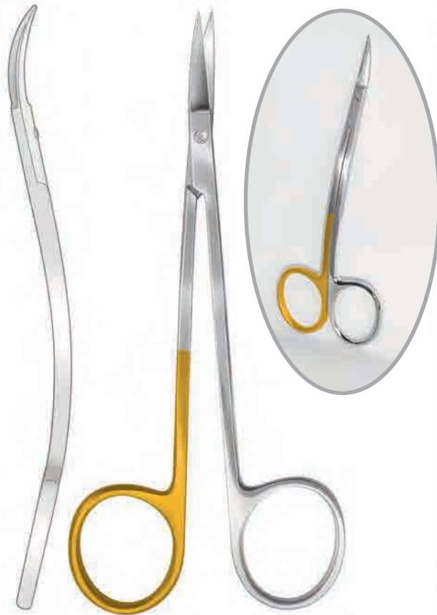
02 0408 11 1 La Grange 115 mm S-förmig gebogen curved like a S