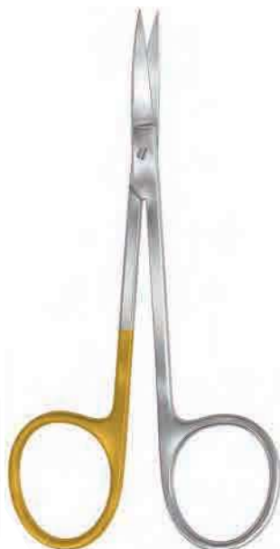
02 0404 11 1 115 mm gerade mit großen Griffingen straight with big grip rings