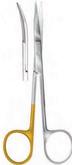
02 0419 13 1 Goldman-Fox 130 mm Gingivektomieschere, gezahnt, gebogen Gingivectomy scissors, toothed, curved