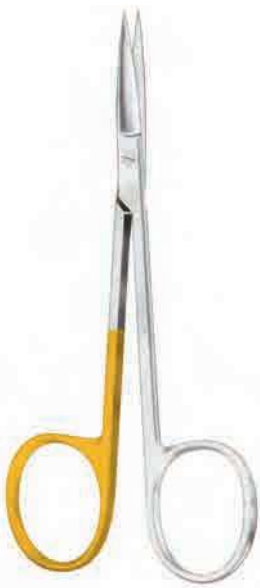
02 0400 10 1 105 mm Zahnfleischscheren, gerade Gum scissors, straight

"KÜRTE EXTRA CUT" ✓ Super sharp ✓ Super cut ! - for every surgical use in clinic and practice -