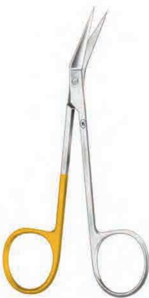
02 0402 11 1 115 mm Zahnfleischscheren, abgewinkelt Gum scissors, angled