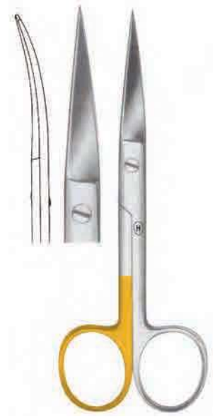
02 0415 13 1 Standard 130 mm Chirurgische Schere, gebogen Operating scissors, curved