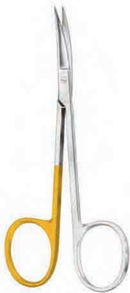
02 0401 10 1 105 mm Zahnfleischscheren, gebogen Gum scissors, curved