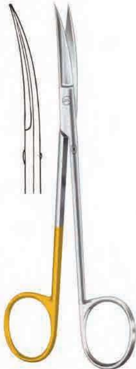
02 0411 14 1 Joseph 140 mm Feine chirurgische Schere, gebogen Delicate operating scissors, curved

"KÜRTE EXTRA CUT" ✓ Super sharp ✓ Super cut ! - for every surgical use in clinic and practice -