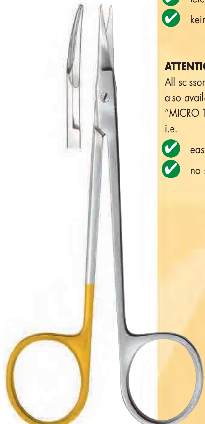
02 0409 11 1 115 mm Turmspitz-Schere, gebogen Tower-pointed scissors, curved