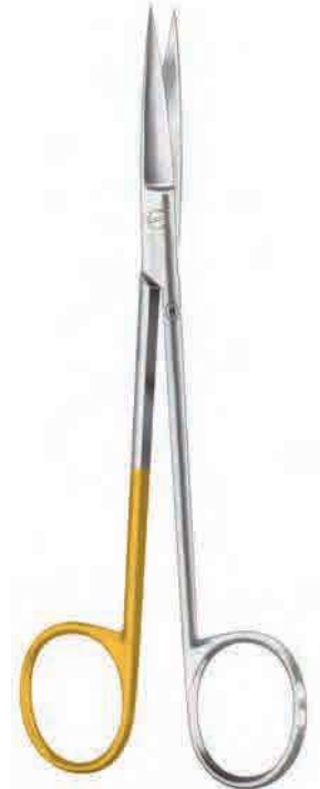
02 0410 14 1 Joseph 140 mm Feine chirurgische Schere, gerade Delicate operating scissors, straight