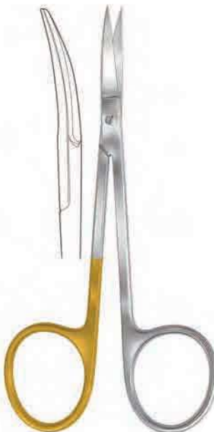
02 0405 11 1 115 mm gebogen mit großen Griffingen curved with big grip rings