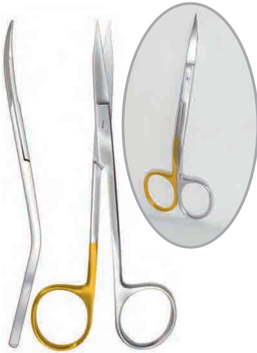
02 0418 13 1 Goldman-Fox 130 mm Gingivektomieschere, gezahnt, S-förmig gebogen Gingivectomy scissors, toothed, curved S-shaped