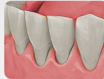
Antes del tratamiento

SZ Flow LC Gum es un composite fluido, radiopaco y fotopolimerizable de alta viscosidad. Se puede utilizar para cavidades y defectos en forma de V en las zonas cervicales expuestas por recesión gingival. Combinando el fácil manejo de un compuesto fluido con los altos valores físicos de un composite.